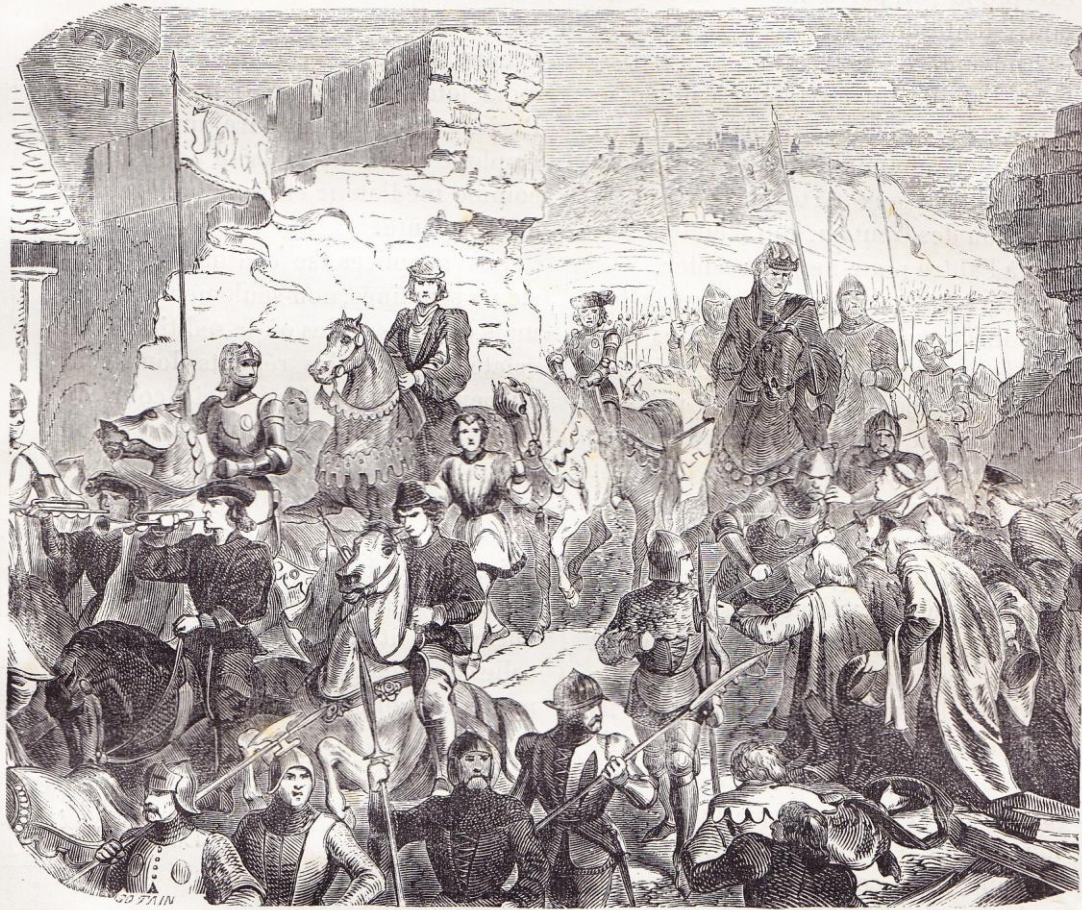
Charles VI, vainqueur des Flamands, entre à Paris par la brèche (1383).

de Male, venaient, dirigés par Pierre Dubois et Philippe Arteveld, fils du célèbre brasseur, de le vaincre en bataille rangée, devant Bruges (3 mai 1382). Les chaperons blancs , ainsi que s'appelaient les révoltés, n'étaient plus une faction; ils tendaient à devenir un gou-