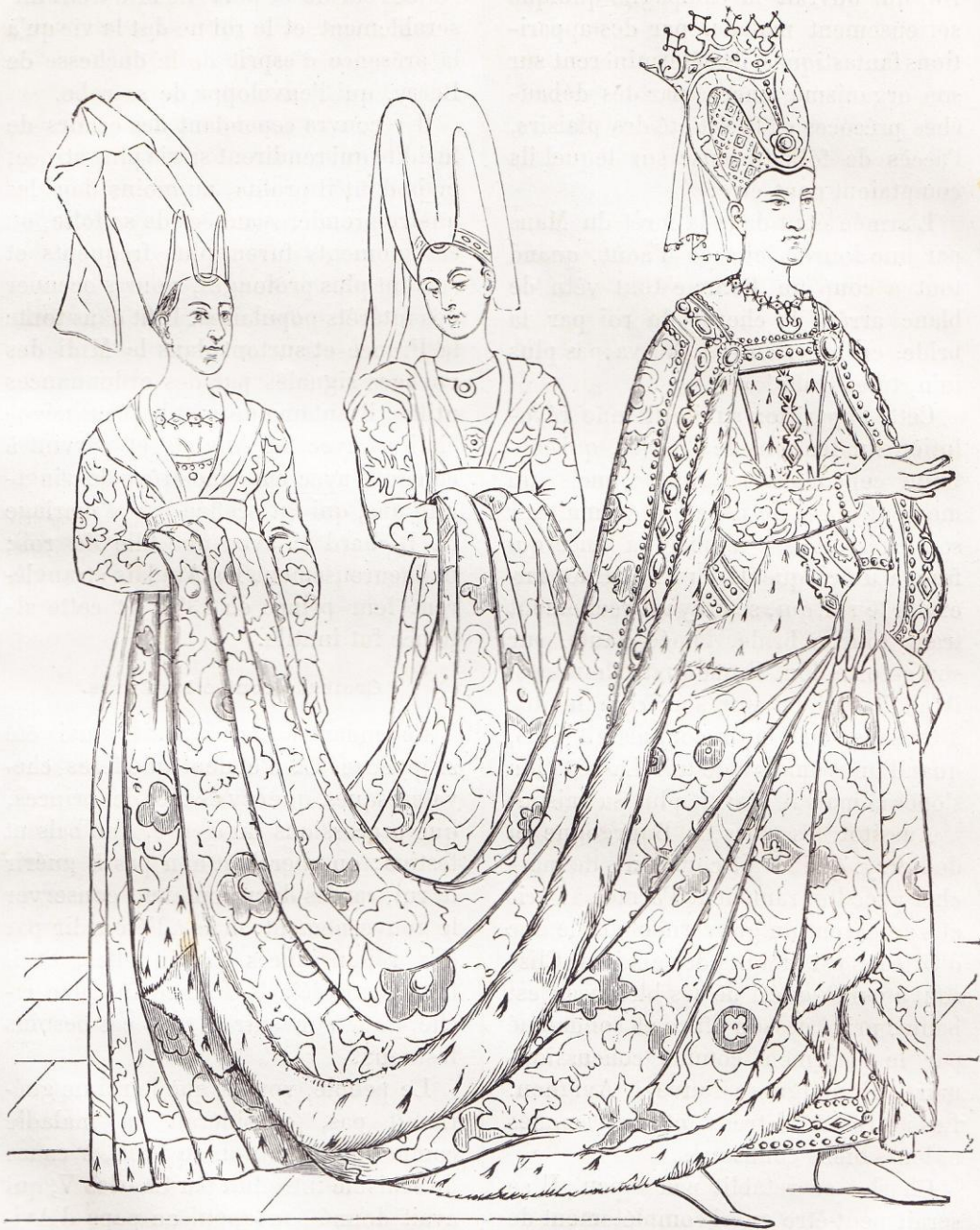
Isabeau de Bavière, mariée à Charles VI, 18 juin 1385.

mourir, avait fait un testament par lequel il disposait de dix-sept cent mille francs en biens meubles, et leur haine pour le connétable s'était accrue